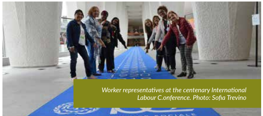
Worker representatives at the centenary International Labour Conference.