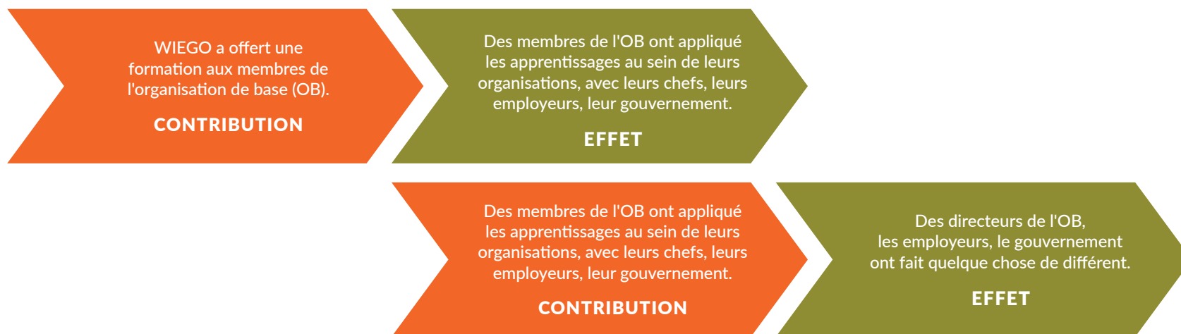
Figure : Un effet antérieur devient une contribution pour un effet postérieur

NOTE à l'animatrice-ur : Dans ce cas, le premier effet (décrit en étape 3), c'est-à-dire l'action entreprise par la-le participant-e à l'atelier, a influencé l'effet écrit dans l'étape 6. Alors cet premier effet devient la contribution à l'effet dans l'étape 6. Ainsi, elle commence comme un effet dans l'étape 3 qui, à son tour, influence (c'est-à-dire, contribue à) un autre effet. Après cet atelier, ce-tte décideuse-ur ou quiconque est le QUI dans l'effet ci-dessus, peut franchir une nouvelle étape. De cette façon, vous générez une chaîne d'effets, une histoire de changement, de laquelle WIEGO est un contributeur indirect.