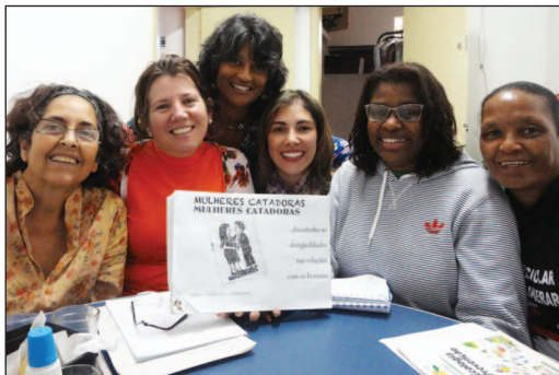
Ébauche de la boîte à outils populaire sur les questions de genre

« Ce que nous devons faire, c'est de faire partie d'un groupe qui discute de l'autonomie; quand nous agissons en groupe, nous pouvons faire avancer notre autonomie... »