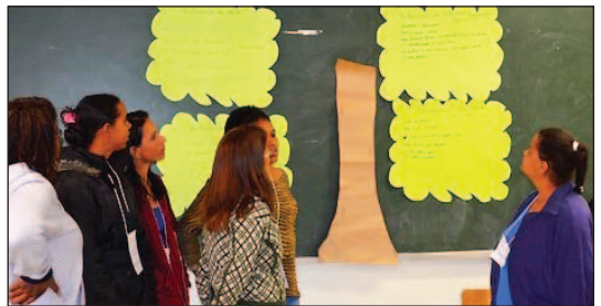
Arbre de l'autonomie – exercice axé sur la discussion des différentes dimensions de l'autonomisation des femmes.