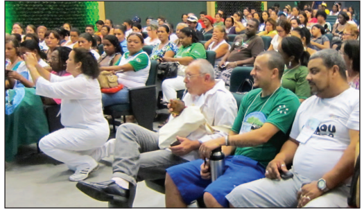
Réunion au Festival Déchets et citoyenneté 2012 pour recueillir des réactions à la première phase du projet