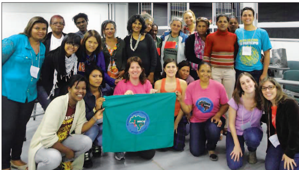
Photo de groupe de femmes participant à l'atelier de la région métropolitaine de Belo Horizonte

Les méthodes participatives sont essentielles pour explorer les nombreuses facettes de la soumission et de la discrimination que connaissent les récupératrices de matériaux, ainsi que pour créer des ressources propices à leur autonomisation et à l'ouverture de possibilités pour leur émancipation économique.