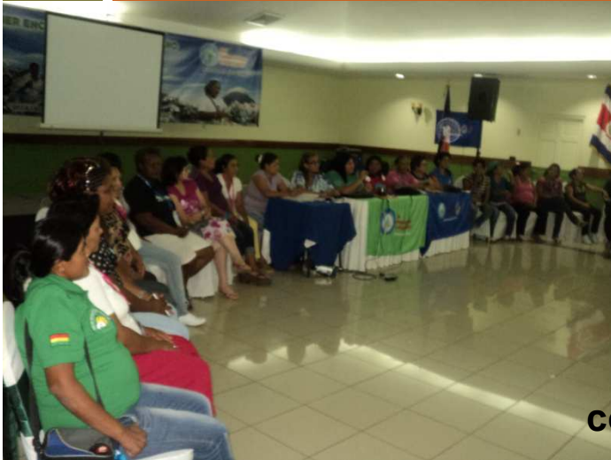
Nicaragua: criação do comitê de gênero Redlacre, fevereiro 2012