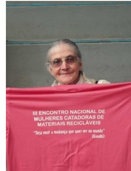
Reuniões informais – encontro da mulher catadora, Curitiba 2012