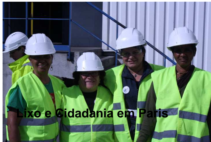
Lixo e Cidadania em Paris