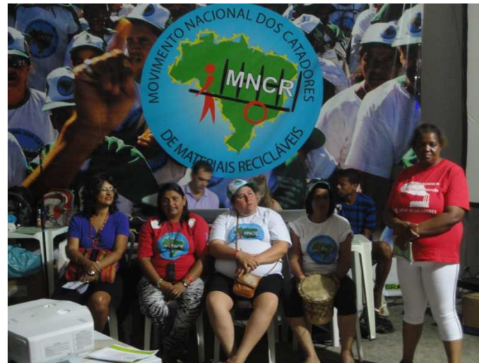
Debate Gênero Rio+20 2012