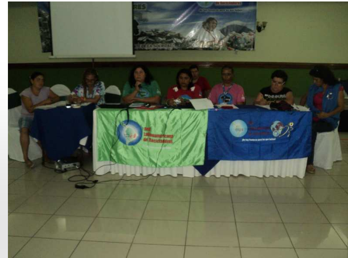
Nicaragua: criação do comitê de gênero Redlacre, fevereiro 2012