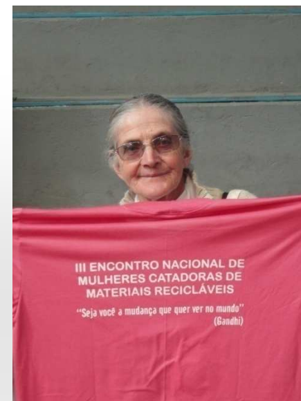
Reuniões informais – encontro da mulher catadora, Curitiba 2012