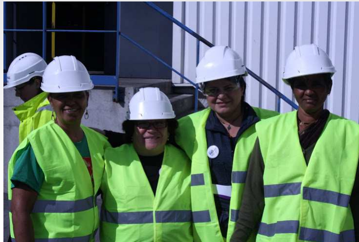
Lixo e Cidadania em Paris