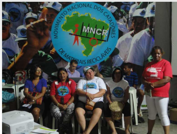
Debate Gênero Rio+20 2012