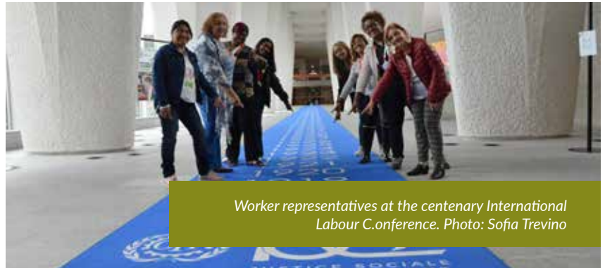
Worker representatives at the centenary International Labour Conference.

Deseo que haya un Convenio que esté apoyado por una Recomendación que se centre en acabar con la violencia y el acoso en el mundo del trabajo. Este Convenio también debe incluir los problemas de las trabajadoras y trabajadores de la economía informal para que estén protegidos por el mismo Convenio.