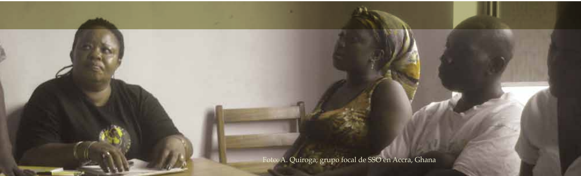
grupo focal de SSO en Accra, Ghana

Considerando el progreso hecho a nivel regulatorio en estos países, un hallazgo llamativo de esta investigación es que ni los trabajadores del hogar en Brasil ni en Tanzania habían experimentado algún tipo de contacto con las instituciones estatales de SSO. Algunos de los trabajadores brasileños dijeron que esto se debía a que los legisladores, siendo ellos mismos empleadores de trabajadores del hogar, no se preocupaban realmente en mejorar sus condiciones de trabajo. Muchos de los trabajadores de Tanzania que fueron entrevistados desconocían por completo que tuviesen cualquier tipo de derecho de trabajo y no pensaban en acudir a las instituciones estatales para solucionar sus problemas. Aquellos que habían experimentado serios abusos de sus derechos habían dependido de la ayuda de los vecinos de sus empleadores para escapar de la situación.