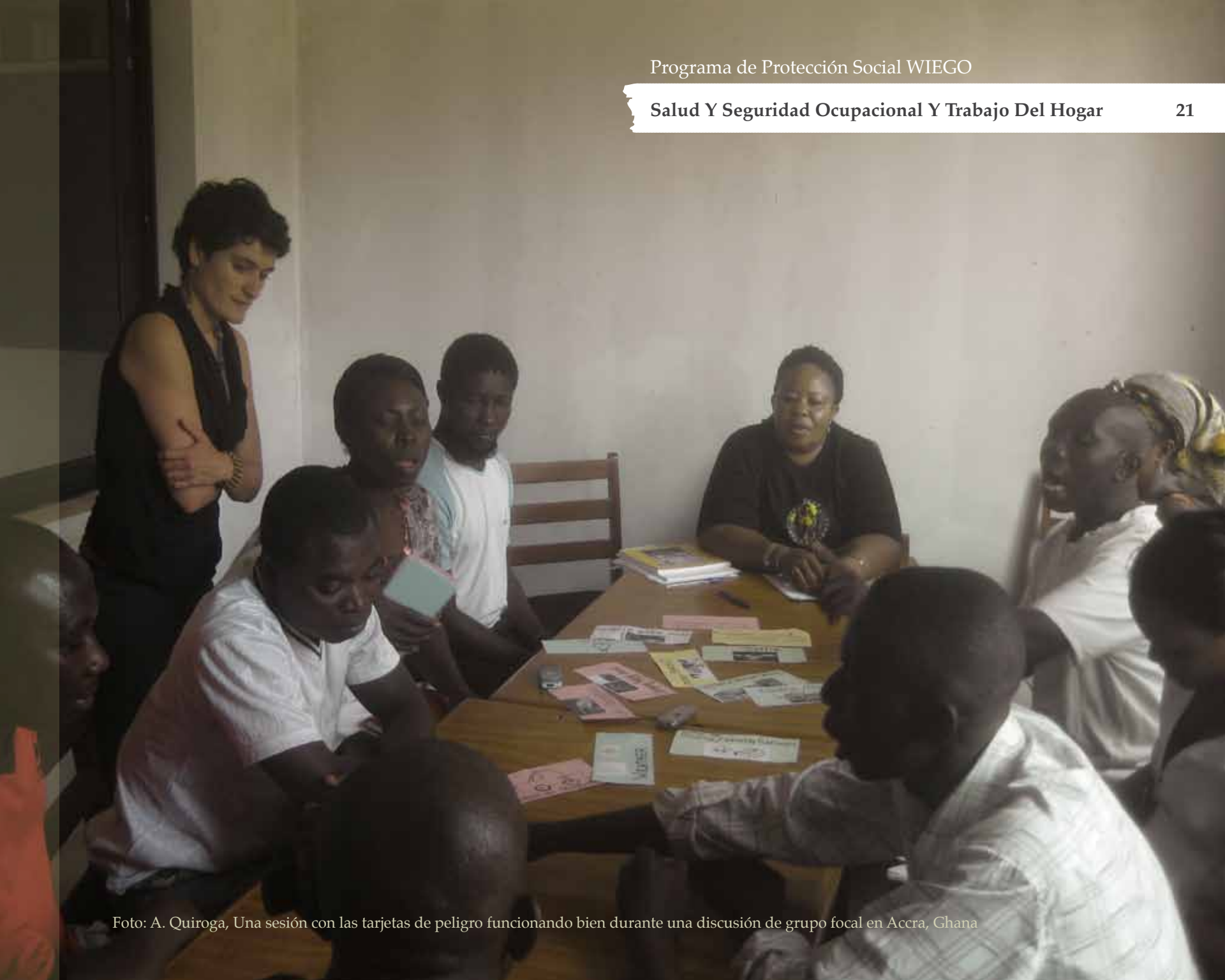
Foto: A. Quiroga, Una sesión con las tarjetas de peligro funcionando bien durante una discusión de grupo focal en Accra, Ghana