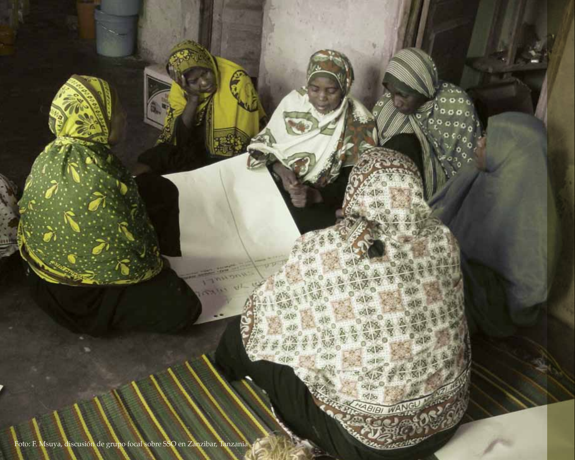
discusión de grupo focal sobre SSO en Zanzibar, Tanzania