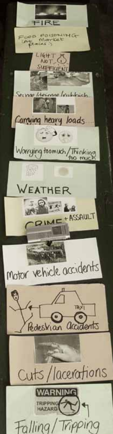
Foto: L. Alferts, tarjetas de peligro desarrolladas durante un ejercicio de grupo focal con vendedores ambulantes y de mercado en Accra, Ghana. La imagen ilustra lo que sus tarjetas podrían parecer.