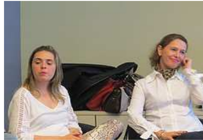
Equipe do ICF