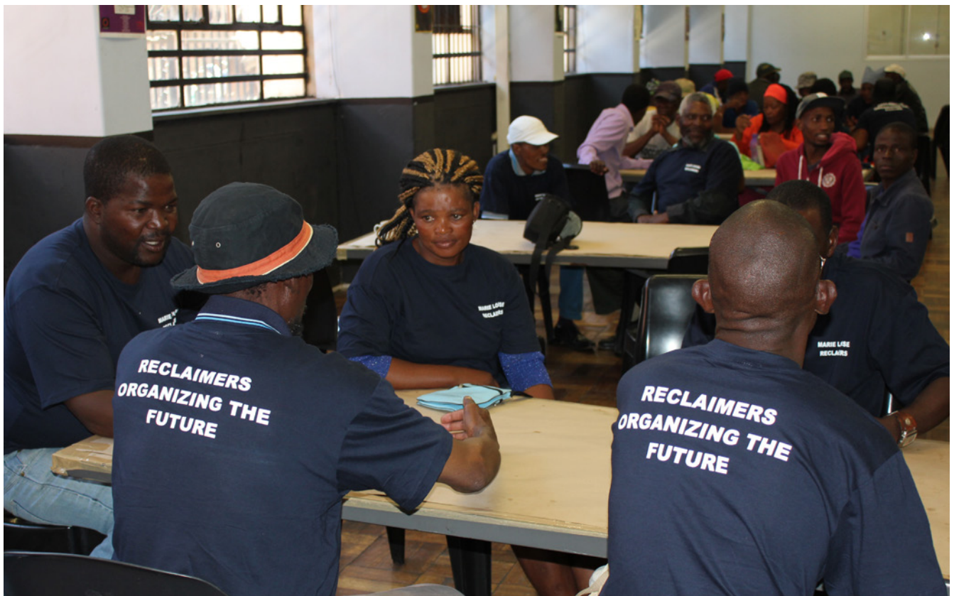
Senepo: J. Barrett