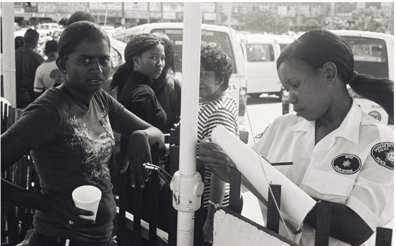
Senepe: J. Rajgopaul