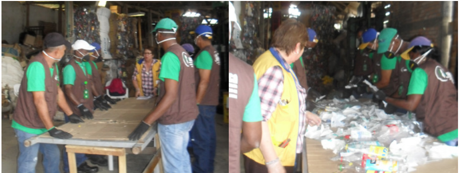
Inicio de prueba de desempeño y producto. Fotos: M. E. Duque, Popayán, 2016