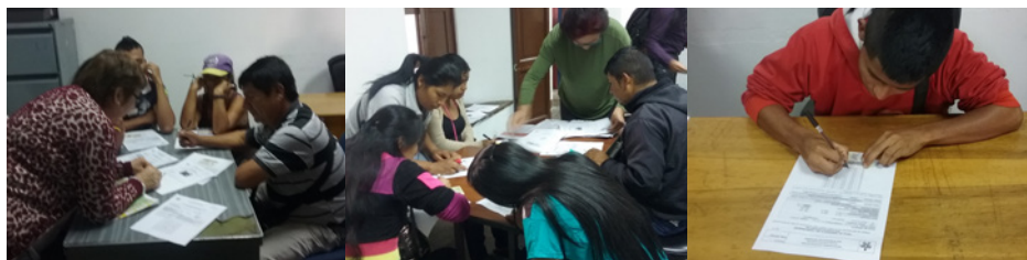
Recicladores presentando oportunidad para recuperar y subir al nivel avanzado.