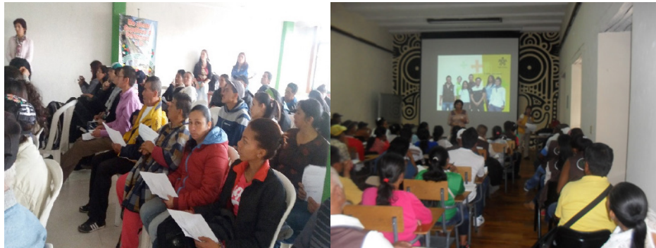
Evaluadora del SENA realizando una actividad de sensibilización. Fotos: M. Orozco, 2016