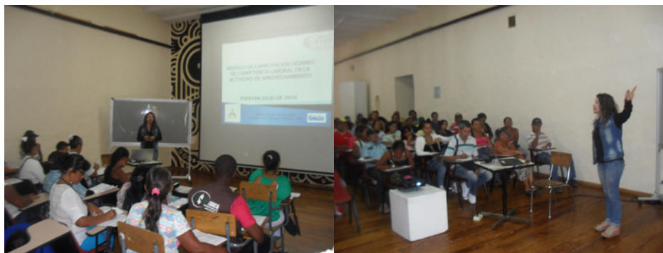
Técnica de apoyo de WIEGO Colombia realizando capacitación en el módulo de competencias laborales en diferentes ciudades.