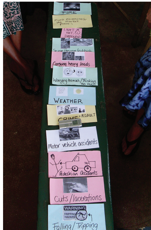
Cartões de risco desenvolvidos durante um exercício de grupo focal com camelôs e vendedores do mercado em Acra, Gana.

Duas técnicas importantes que foram usadas durante as discussões do grupo focal foram “cartões de risco” e a “lista de verificação de saúde”. Cartões de riscos possuem figuras e palavras descrevendo riscos de saúde e segurança comuns e são colados em áreas de comércio. Estes cartões eram expostos e participantes podiam adicionar qualquer