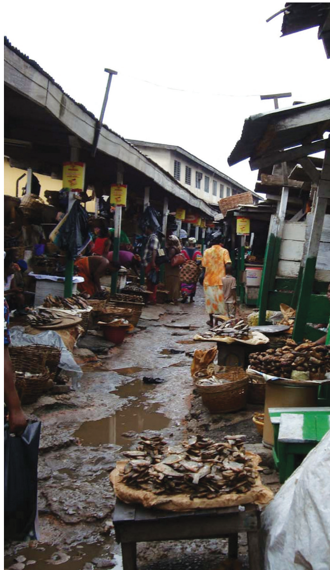
Os perigos de Saúde encontrados em mercados em Accra, Gana, 2010.

Muitos trabalhos informais não são somente “flexíveis, precários e inseguros”, mas também arriscados e são localizados em lugares insalubres e perigosos. Tais ambientes de trabalho podem incluir aterros sanitários,