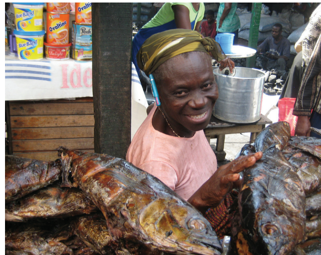
Vendedor de mercado en Acra, Ghana, 2011.

Los “ chop bars ” son locales informales de comida, generalmente administrados por mujeres, que son comunes a lo largo de Ghana. En el verdadero estilo ghanés, estos pequeños restaurantes que venden comidas locales (en adelante “ chop bars ”) tienen nombres pintorescos tales como “El Chop Bar Sin Armas”, “El Chop Bar Dios es Grande” y “El Chop Bar los Enemigos Sufrirán.” Estos establecimientos existen tanto en las áreas urbanas como rurales en o cerca de ferias, centros de transporte y al borde de las carreteras, y sirven comida ghanesa tradicional tal como fufu (mandioca hervida y batida), banku (masa de mandioca fermentada cocinada) y sopas leves por bajos precios. Por esta razón, los chop bars son populares entre el público ghanés; durante las horas pico, los lugares más consolidados en Acra sirven hasta 70 personas al mismo tiempo.