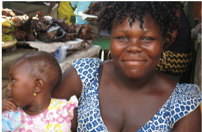
Vendedor de mercado en Accra, Ghana, 2011.

El presente estudio ha demostrado las importantes maneras en que los chop bars contribuyen a la economía local de Acra. Todos los negocios encuestados pagaban impuestos y tasas de licencia al gobierno local como también tasas básicas de servicios para la remoción de residuos y agua. Impuestos y tasas de los trabajadores informales tales como estos dueños de los chop bars constituyen la mayor porción de ingresos para los gobiernos locales en Ghana (entrevista, Instituto para el Estudio de Gobierno Local 2010), entonces de una forma muy real estos negocios ayudan a mantener las estructuras administrativas de la ciudad. Además, los negocios también ayudan al desarrollo económico local al proporcionar empleo asalariado para una gran cantidad de otros trabajadores informales. En general, la contribución de los chop bars a la economía local de Acra es importante. Resulta más llamativo aún, entonces, que sus negocios se encuentren con tanta frecuencia bajo la amenaza de las autoridades locales, que parecen ver a los chop bars como molestias en lugar de contribuyentes válidos a la economía local como de hecho lo son.