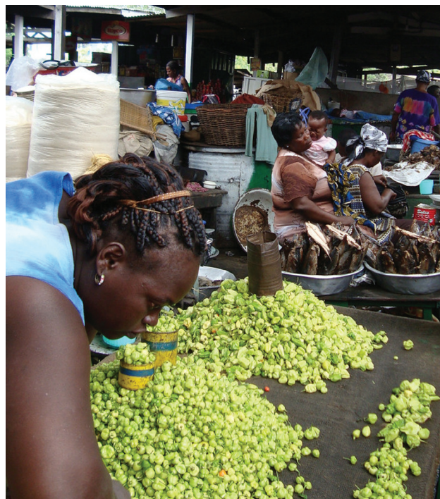
Vendedor ambulante en el mercado de Makola, Ghana, 2004.

Las entrevistas dejaron en claro que llevar adelante un chop bars es estresante y requiere de largas horas de trabajo. Muchos de los dueños de los negocios y sus empleados empezaban a trabajar a las 4:30 hs de la mañana y continuaban trabajado a lo largo del día hasta las 18:30 hs, haciendo que sea un día de trabajo de 14 horas. No es sorprendente, entonces, que muchos dueños de chop bars informaron que ellas y sus empleados sufrían de una fatiga crónica y de mala salud relacionada con el exceso de trabajo y el estrés. La tabla 3 y la tabla 4 sintetizan estos problemas de salud y sus causas.