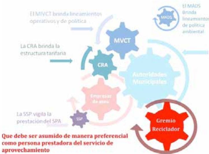
GRÁFICO 4: Nuevo Marco institucional del servicio público de aseo

Nota: MVCT (Ministerio de Vivienda, Ciudad y Territorio); CRA (Comisión Reguladora de Agua Potable y Saneamiento Básico); MADS (Ministerio de Ambiente y Desarrollo Sostenible), SSP (Superintendencia de Servicios Públicos); PGIRS (Planes de Gestión Integral de Residuos Sólidos), EC (En construcción).