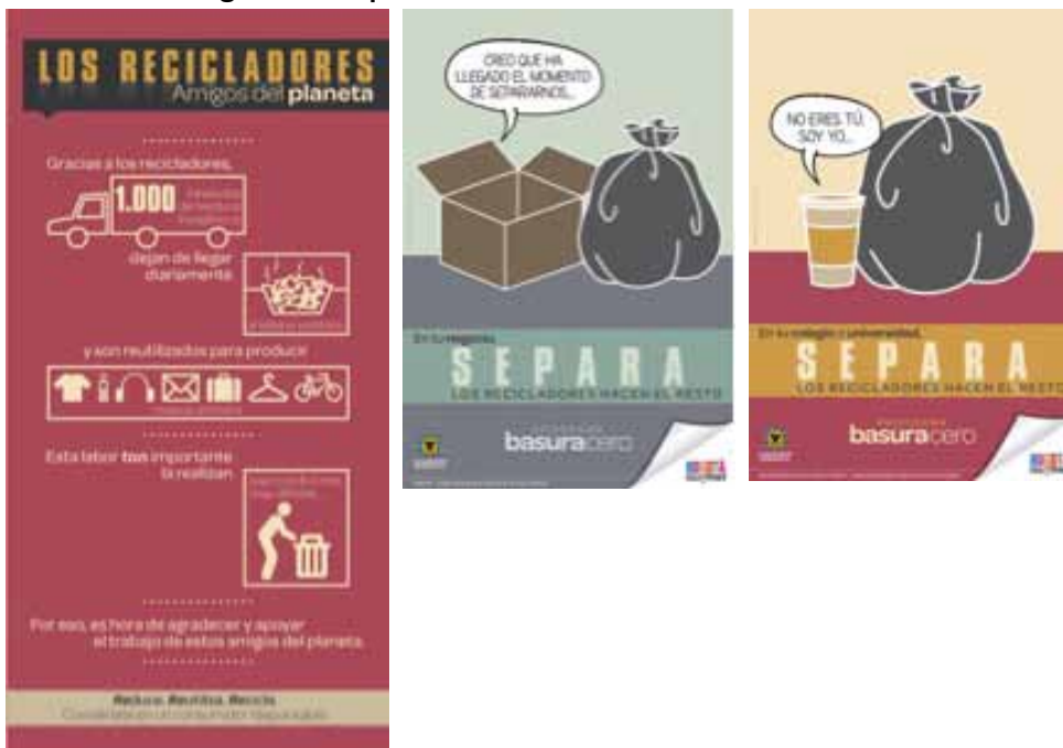
GRÁFICO 3: Imagen de campaña

Promoción de separación y entrega del reciclaje a los recicladores. Se están desarrollando una serie de campañas mediáticas que buscan el cambio de hábitos de separación bajo el esquema de bolsa blanca para residuos reciclables y bolsa negra para residuos no reciclables. Esta campaña ha tenido especial énfasis en la visibilización del reciclador como gestor de los residuos. Bajo el lema “separa, el reciclador hace el resto”, la campaña ha buscado sensibilizar a los usuarios del servicio de aseo sobre su responsabilidad con la ciudad y con el reciclador. Es muy temprano para medir su impacto, no obstante, varios líderes recicladores han manifestado que ellos al igual que sus bases sociales han sentido un ligero y positivo cambio en las relaciones con otros actores de la ciudad. No obstante, es preciso generar mecanismos no sólo de sensibilización, sino también de exigibilidad de la separación y entrega de residuos reciclables a los recicladores por parte de la ciudadanía en general.