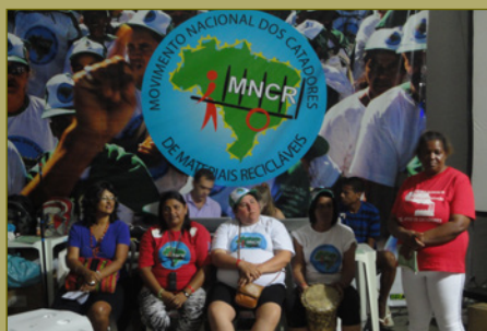
Rio+20, junho de 2012.