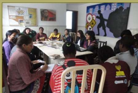
Encontro com as Catadoras em Belo Horizonte, em maio de 2012.

O envolvimento das catadoras foi um passo importante na promoção de uma reflexão mais crítica sobre a dinâmica de gênero entre catadoras e catadores. Em 2013, as equipes do NEPEM