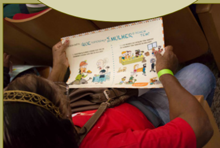
Fotos da reunião com catadores e catadoras do Brasil e da América Latina para discutir o projeto Gênero e Reciclagem em abril 2015.

“Não estamos ganhando dinheiro com o workshop, e sim ganhando conhecimento. Por isso a participação de todas é importante”.