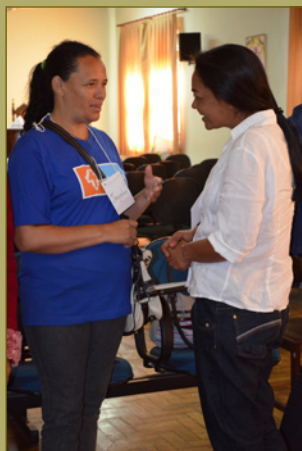
Quebra-gelo com as catadoras de Conselheiro Lafaiete (E), em agosto de 2013, e da região metropolitana de Belo Horizonte (D), em maio de 2013.

Observações: Muitas vezes, ao apresentar a parceira para o grupo, uma das mulheres esquecia o que a outra participante havia dito. Isso foi importante para as participantes, já que isso chamou a atenção para a necessidade de as participantes se fortalecerem em suas habilidades de escuta e memória.