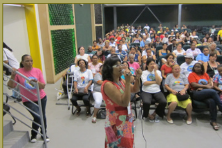
Festival Lixo e Cidadania, outubro de 2012.