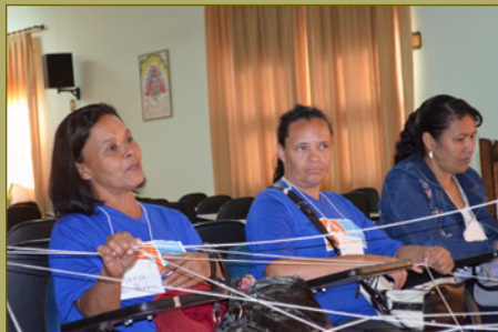
Fotos dos workshops em Conselheiro Lafaiete, agosto de 2013 e em Itaúna, outubro de 2013.

conectar as experiências de gênero vividas e discutidas pelas próprias mulheres. As respostas variaram entre ter autonomia financeira para ser livre até tomar as próprias decisões na vida. Algumas das respostas mostraram como muitas dessas mulheres, em algum nível, perceberam os efeitos negativos de seus papéis de gênero em diferentes contextos sociais.