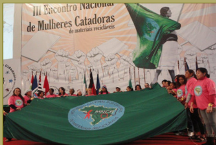
III Encontro Nacional, julho de 2012.