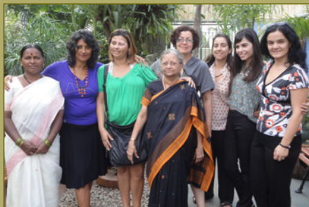
Programa de Rádio da Rio+20, junho de 2012.