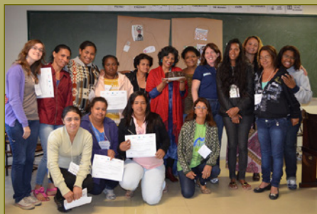
Fotos do workshop na região metropolitana de Belo Horizonte, maio de 2013 e Itaúna, outubro de 2013.