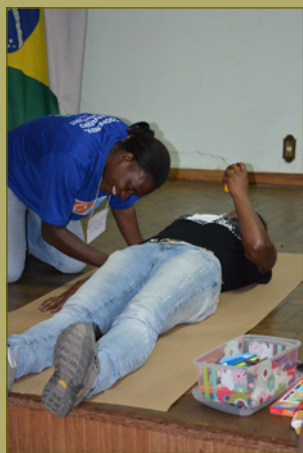
Fotos do workshop em Conselheiro Lafaiete, agosto de 2013 e em Itaúna, outubro de 2013.

Ao ter as mulheres focadas nos diversos atributos conflitantes relacionados aos papéis de gênero, as facilitadoras puderam incentivar uma reflexão mais crítica sobre como as mulheres têm superado diferentes obstáculos e estereótipos na sociedade contemporânea. Essa atividade revelou ainda que, embora as catadoras não demonstrem ter problemas em