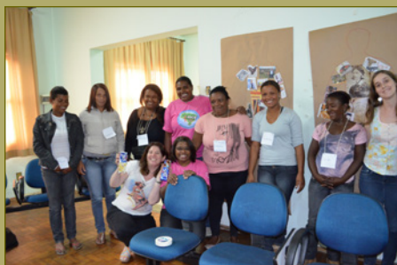
Fotos do workshop em Conselheiro Lafaiete, agosto de 2013 e em Itaiúna, outubro de 2013.