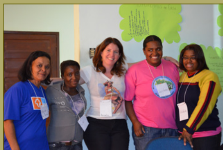
Imagem do workshop em Conselheiro Lafaiete, agosto de 2013.

“Precisamos aprender mais sobre as mulheres na coleta de materiais recicláveis”.