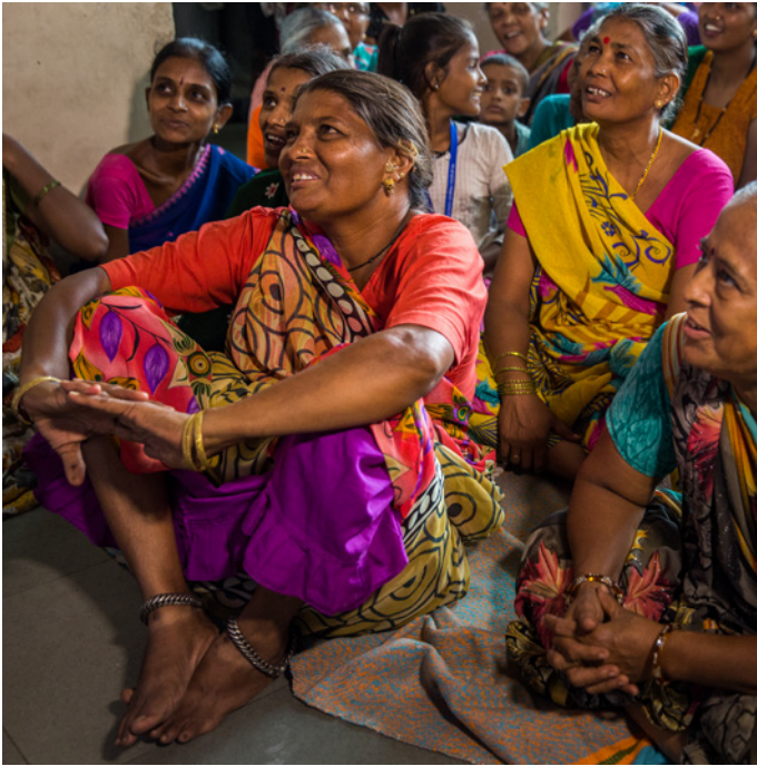
กลุ่มผู้หญิงที่ฟังการบรรยายในระหว่างการประชุมทางโภชนาการเกี่ยวกับอาหาร เพื่อสุขภาพที่ศูนย์ BalSEWA ในอาห์เมดาบัด ประเทศอินเดีย

อันเป็นผลมาจากการทำงานดูแลที่ไม่ได้รับค่าตอบแทนส่งผลให้ผู้หญิงอาจเก็บออมได้น้อยเพื่อใช้ในยามชรา ถึงแม้ว่านี่จะเป็นปัญหาที่แรงงานหญิงทุกคนต้องเผชิญ แต่ปัญหานี้พบรุนแรงที่สุดในแรงงานนอกระบบในซีกโลกใต้ เนื่องจากแรงงานเหล่านี้ไม่สามารถเข้าถึงการคุ้มครองแรงงานและการคุ้มครองทางสังคมที่ช่วยให้แรงงานหญิงในระบบสามารถจัดการงานดูแลลูกหลานและงานหารายได้ไปพร้อมๆ กัน หากมองในแง่นี้ หน้าที่รับผิดชอบงานให้การดูแลที่ไม่ได้รับค่าตอบแทนจึงเป็นการสร้างและส่งเสริมให้เกิดความไม่เท่าเทียมทางสังคม