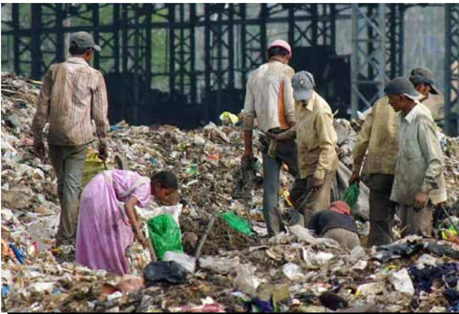
Recicladores buscando material en un vertedero en Pune, India.

En la Ronda 1, muchos de los encuestados dijeron a los investigadores que, a pesar de los menores presupuestos familiares, habían hecho todo el esfuerzo posible para mantener a sus hijos en la