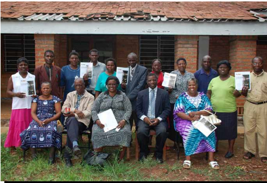
Participantes con el primer informe del estudio, “ Sin colchón que amortigüe la caída ” en Blantyre, Malawi.

Después de que los gobiernos y los contribuyentes gastaron miles de millones de dólares para rescatar a los bancos “demasiado grandes para quebrar”, la industria financiera mundial registró