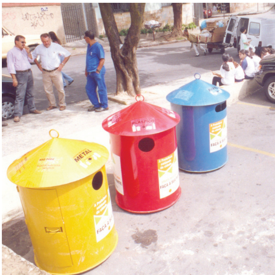
Contêineres de reciclagem são colocados em locais públicos como estacionamentos, áreas de recreação e parques.