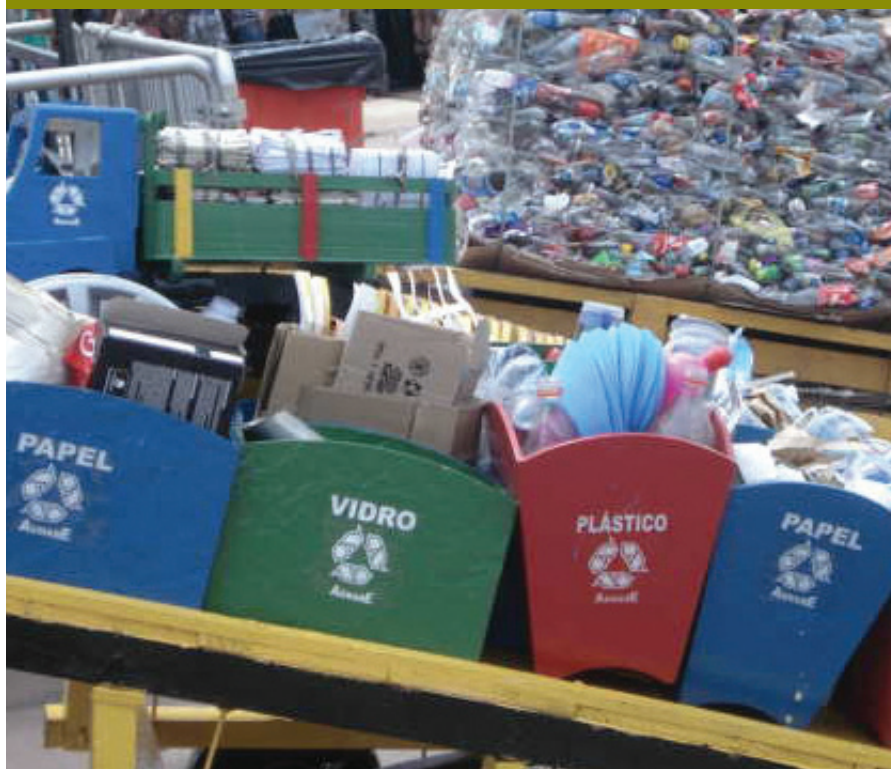
Carrinhos de tração humana são muito usados por catadores na coleta de recicláveis nas ruas do centro de Belo Horizonte.