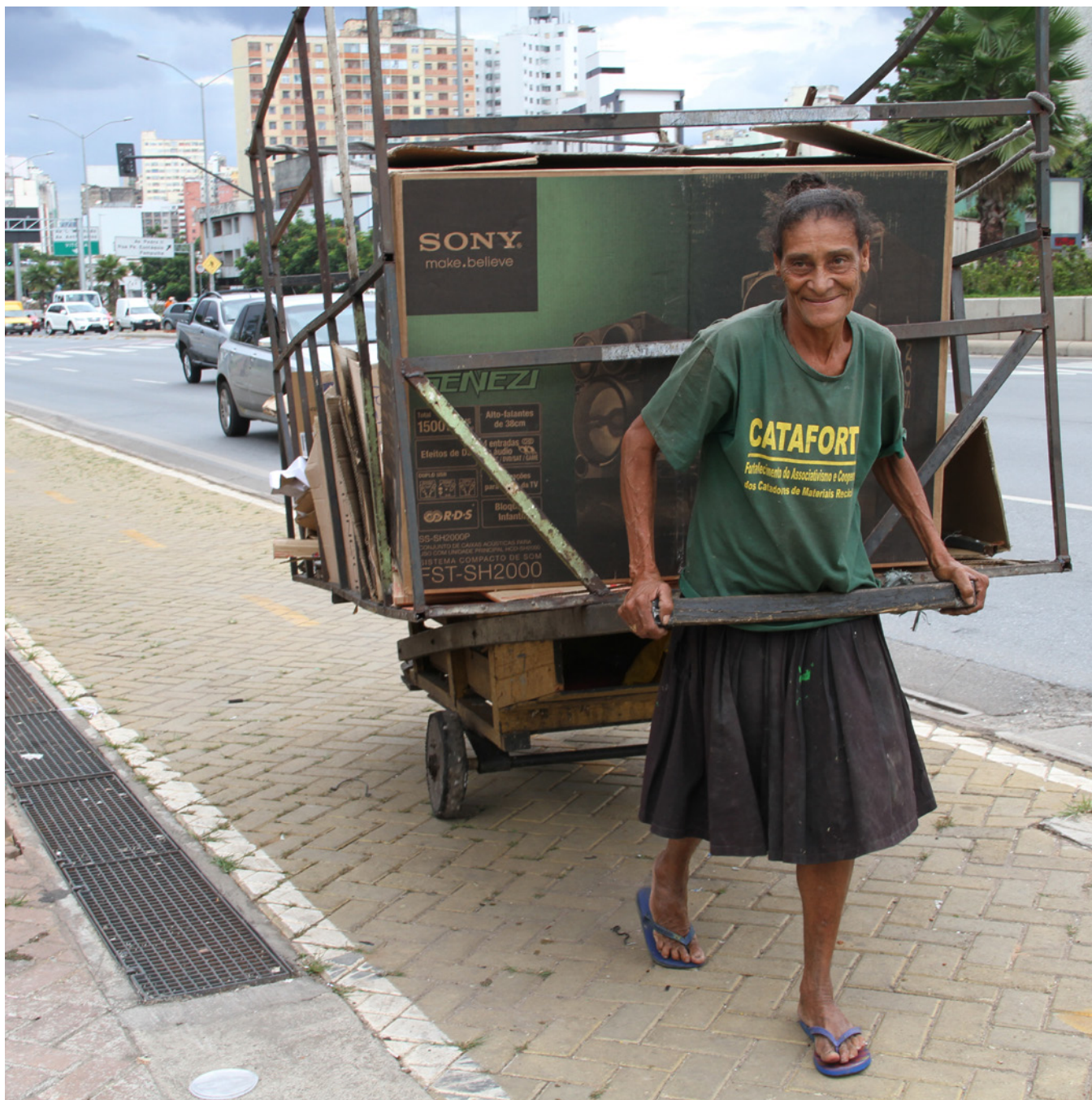
Catadora puxa um carrinho para coletar o que outras pessoas jogaram fora.