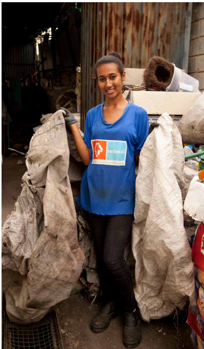
Essa catadora brasileira faz parte da rede de segundo grau de cooperativas Redesol no estado de Minas Gerais.