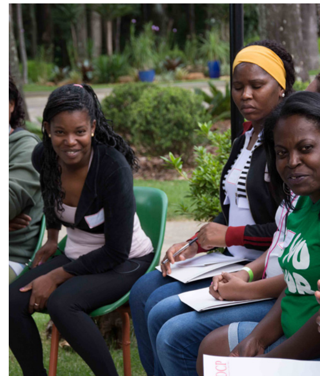
Catadoras participando de uma atividade do Projeto de Gênero.

país. O Brasil recicla 97% de latas e 67% de papelão. 5 Dado que apenas um quarto de todos os municípios possuem sistemas de separação na fonte, as altas taxas de reciclagem se devem ao trabalho dos catadores. 6