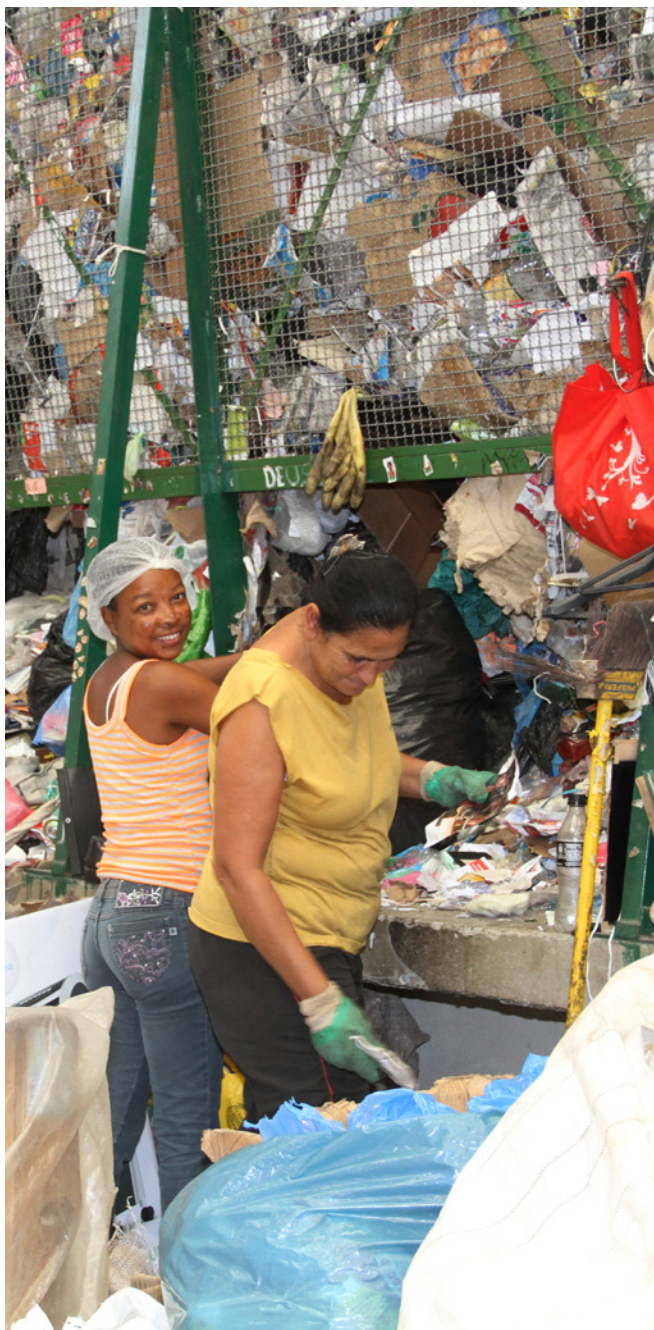
Em Belo Horizonte, trabalhadoras separam materiais em sua central de triagem.