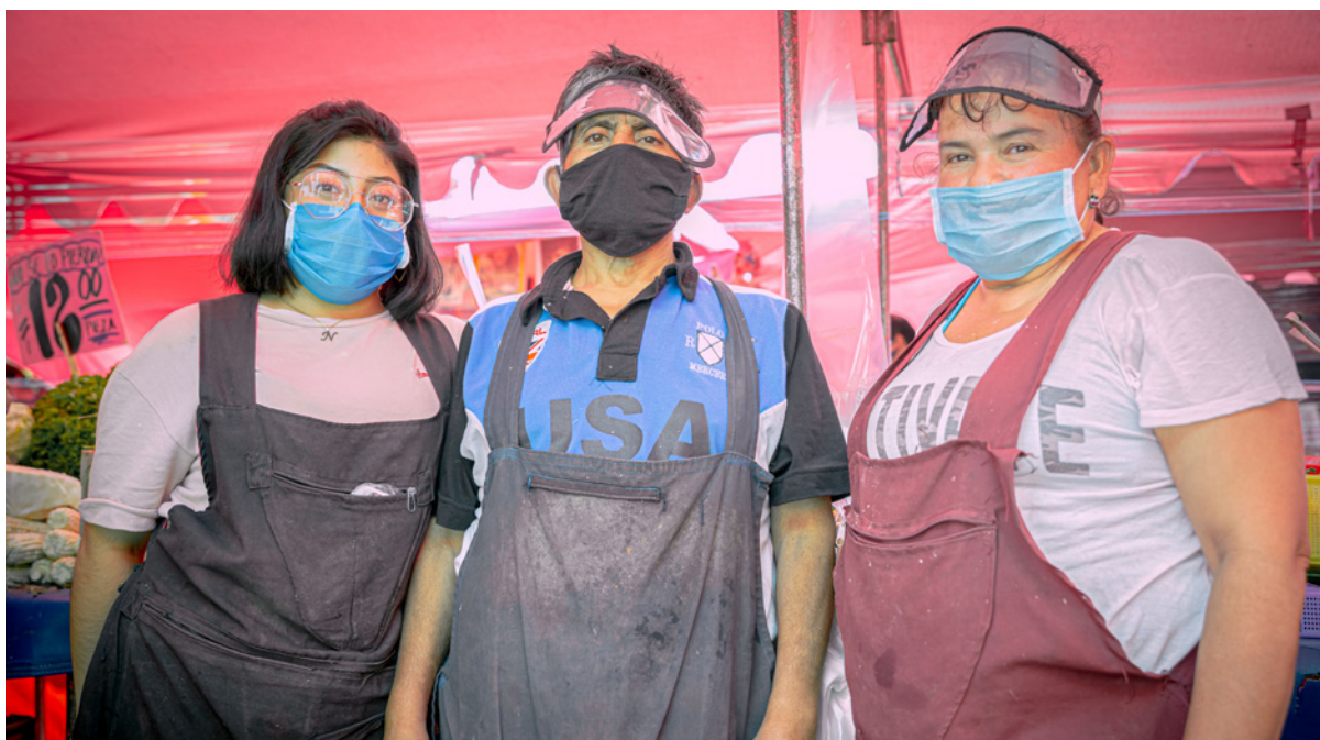
Tianguistas (personas vendedoras ambulantes) en un mercadillo del distrito Gustavo A. Madero, Ciudad de México, al inicio de la pandemia de la COVID-19.

“Si no trabajamos todos los días, no comemos.”