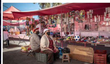
Vendedoras ambulantes en Lima, Perú, y Ciudad de México durante la pandemia de la COVID-19.